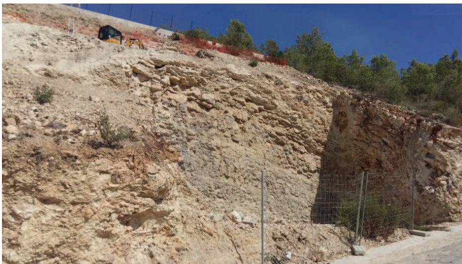
FOTOGRAFIA 1 (calle Sa Noguera nº 7)

La constatación sobre el terreno de la "situación ambiental y paisajística del polígono 32 - ca n'Escandell- y de las obras que se ejecutan en estos momentos, en el ámbito objeto de la modificación de la normativa, queda reflejada en las fotografías que se exponen a continuación: