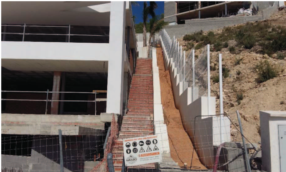
FOTOGRAFIA 5 (calle Sa Noguera nº 3). El terreno natural original del retranqueo ha desaparecido, dando paso a un acceso con una escalera de obra y una pequeña jardinera.

Las fotografías del punto 1.1 exponen una visión general del destrozo del terreno a partir de las licencias otorgadas con la Revisión del PGOU de 2016. En las siguientes imágenes se ve como las excavaciones, que se realizan dentro del espacio de retranqueo, llegan al límite de las parcelas. Es decir, la excavación afecta a casi toda la superficie de la parcela, eliminando la totalidad de la topografía y la vegetación existente en dicha parcela y ejecutando una "reparación" del terreno inicial de forma basta, sin la orografía ni la vegetación original.