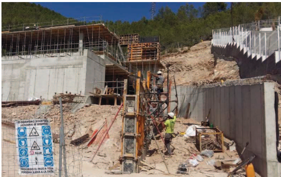
FOTOGRAFIA 7 (calle Sa Noguera nº 1) En esta fotografía se puede observar que casi toda la superficie de la parcela ha sido sometida a excavación del terreno hasta el nivel del sótano. Por lo tanto, ninguna zona libre de la parcela tiene la topografía y la vegetación del estado inicial.

Debido a esta nueva situación de construcción en un gran número de parcelas y el impacto visual que representan, el Ayuntamiento de Eivissa consideró necesario acordar la suspensión de licencias en el ámbito del Polígono 32, con el fin de tener la oportunidad de realizar un análisis, elaborar y aprobar una ordenación urbanística de la zona, con tendencia a minimizar el impacto paisajístico y ambiental que supone la construcción de edificaciones en la zona no consolidada que asciende, aproximadamente, al 58% de las parcelas edificables resultantes del proyecto de compensación.