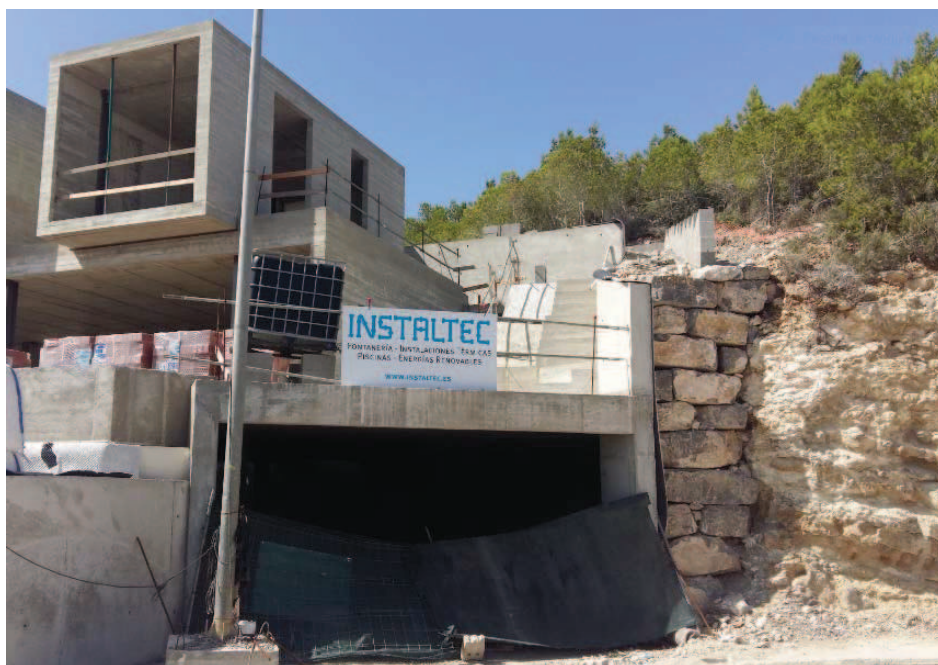
FOTOGRAFIA 6 (calle Sa Fruitera nº 15) Al igual que la fotografía anterior, el terreno que ocupa el retranqueo entre parcelas ha sido excavado, modificado y urbanizado, sin posibilidad de retornar la vegetación autóctona existente que se visualiza en la parte alta.