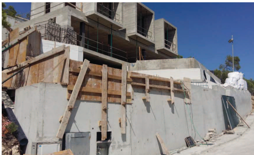
FOTOGRAFIA 8 ( calle Fruitera nº 15)

c.2. Regular la forma de computar los elementos contruidos. La normativa del plan parcial adolece de regulación en la forma de computar los parámetros urbanísticos. Se considera adecuado que, a los efectos de hacer coincidir el aprovechamiento urbanístico y el diseño de las viviendas, se clarifique qué elementos que componen la edificación/construcción/instalación computen a loes efectos de edificabilidad y ocupación. Ello permite paliar los efectos de terrazas, pérgolas y otros elementos siempre que se incluyan en el cómputo de los parámetros.