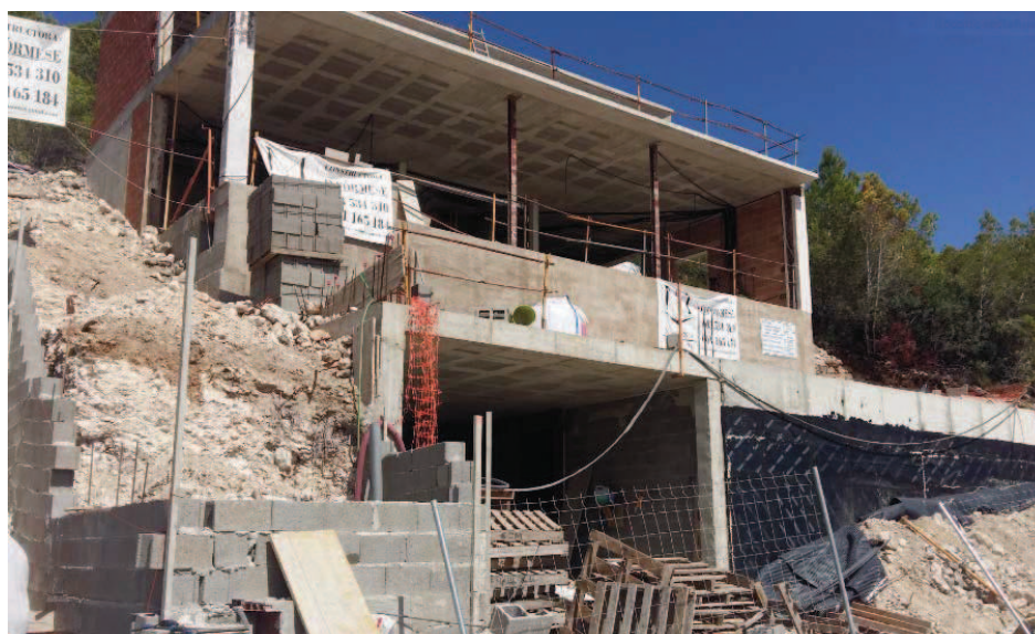
FOTOGRAFIA 4 (calle Sa Fruitera nº 7)

Como se puede constatar en las imágenes de septiembre de 2020, las obras en ejecución de las edificaciones unifamiliares situadas en el ámbito del polígono 32 del PGOU, provocan un impacto medioambiental, tanto en el terreno como a la vegetación, muy elevado y un impacto visual poco identificativo de lo que se considera paisajismo urbano adecuado.