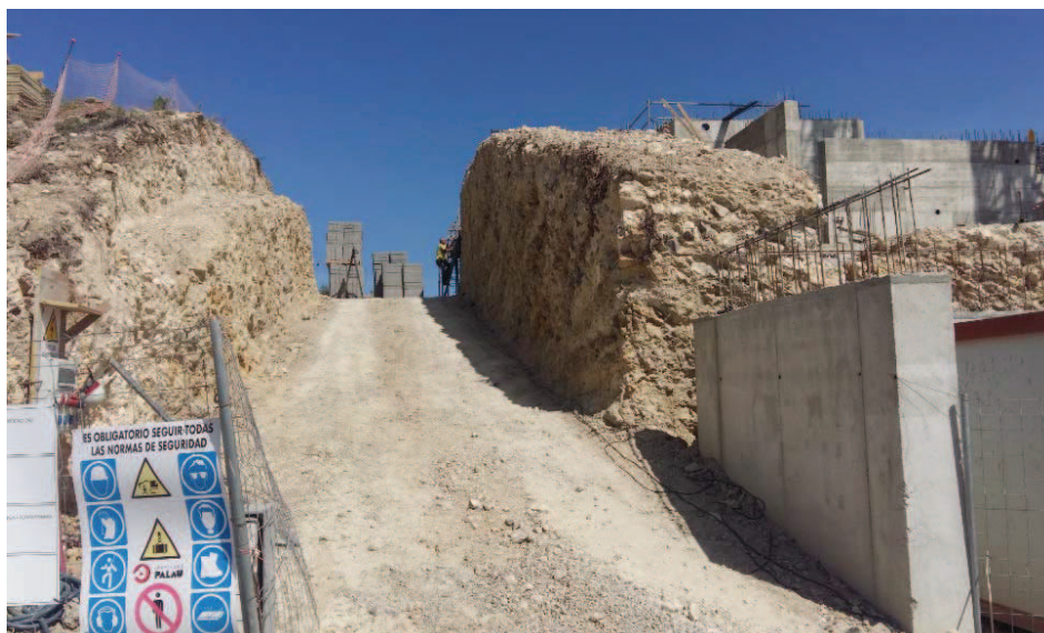
FOTOGRAFIA 3 (calle Sa Noguera nº 30)