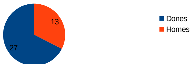
Sexe de les persones participants al qüestionari extern