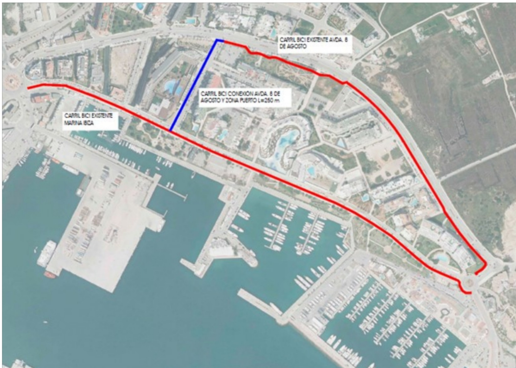
CARRILES BICI PROPUESTOS EN LA OPERACIÓN (AZUL)

La construcción de nuevos carriles bici se realizará conforme a los criterios y especificaciones del Plan de Movilidad Urbana Sostenible (PMUS) de Ibiza. Paralelamente