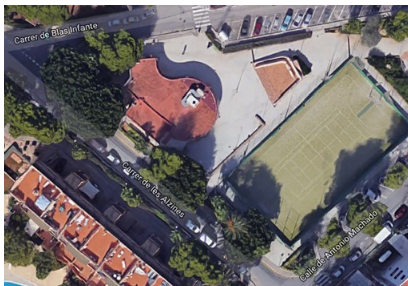
LOCALIZACIÓN DEL EDIFICIO OBJETO DE LA OPERACIÓN

El Centro Social de Platja d'en Bossa alberga la sede de la Asociación Vecinal de Platja d'en Bossa, constituida en 2018 con el objetivo de revitalizar el barrio. El edificio cuenta con un espacio de bar-cafetería actualmente en desuso.