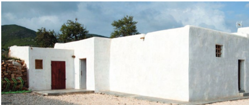
IMAGEN DE CAN TOMEU

La operación consiste en la puesta en valor del equipamiento patrimonial Can Tomeu mediante la restauración de la cisterna y el pozo tradicional de esta antigua casa payesa y la creación de huertos urbanos en la finca.