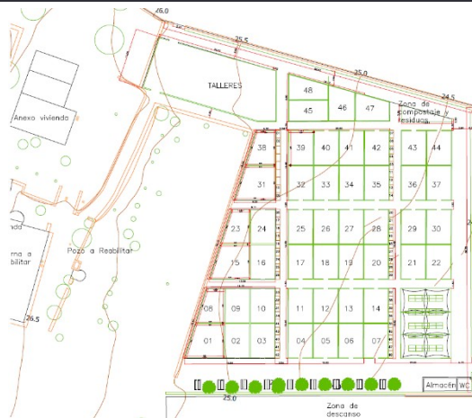
PLANO DE LOS HUERTOS PROYECTADOS

Los huertos urbanos estarán destinados a cualquier persona interesada; si bien se establecerá preferencia para las personas mayores de 55 años, personas en riesgo de exclusión social, personas con discapacidad.