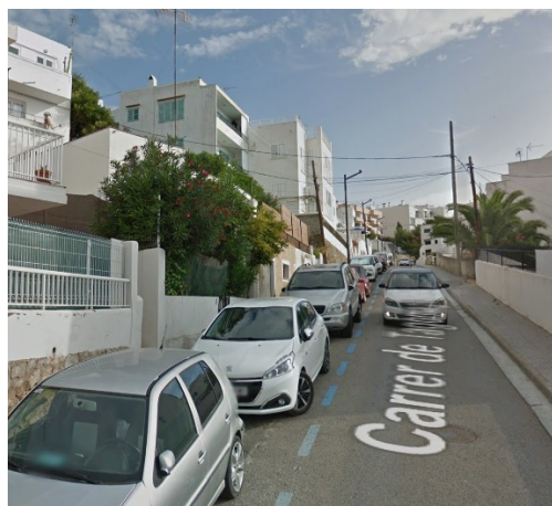
PUNTO DE ACCESO (IZQ.) Y SALIDA (DCH.) AL ACIRE PLANTEADO (GOOGLE STREET VIEW)

Los problemas de estacionamiento de los vecinos y vecinas se acrecientan en época estival, cuando, a causa de la gran cantidad de turistas que aparcan sus coches de alquiler en la zona, los espacios libres disminuyen.